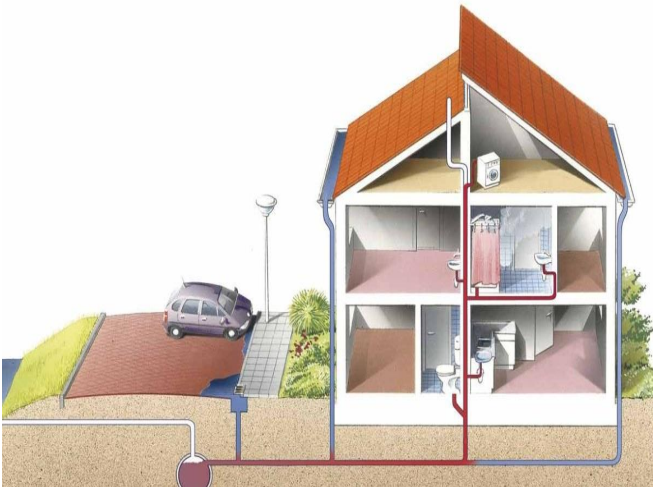
Gemengd rioelstelsel (Paul Maas, Tilburg/Stichting RIONED)

Wanneer de ontluchter op het dak van uw woning niet goed werkt dan zoekt de lucht een andere weg en kan deze via de binnenriolering de woning binnen komen. Controleer daarom de ontluchter op het dak. Het kan voorkomen dat deze dicht zit met bijvoorbeeld bladeren of vogelnestjes.